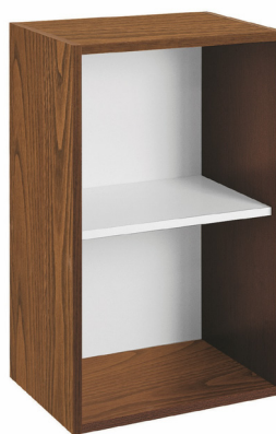
castagno tinto noce (opz.582) schiena e ripiano bianco (opz.001) walnut-stained chestnut (opt.582) white back panel and shelf (opt.001)