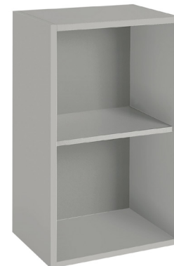
argilla (opz.9690) schiena e ripiano argilla (opz.9690) clay (opt.9690) clay back panel and shelf (opt.9690)