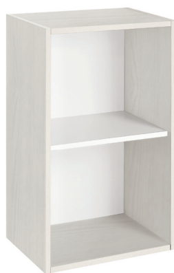
frassino lino (opz.8919) schiena e ripiano bianco (opz.001) linen ash (opt.8919) white back panel and shelf (opt.001)