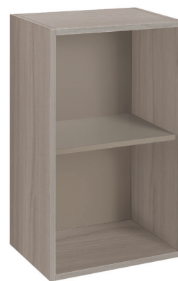
frassino cammello (opz.9485) schiena e ripiano visone (opz.948M) camel ash (opt.9485) mink back panel and shelf (opt.948M)