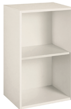
conchiglia (opz.8910) schiena e ripiano conchiglia (opz.8910) shell (opt.8910) shell back panel and shelf (opt.8910)