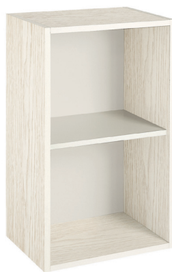
panna decapè (opz.564) schiena e ripiano bianco (opz.001) pickled cream (opt.564) white back panel and shelf (opt.001)