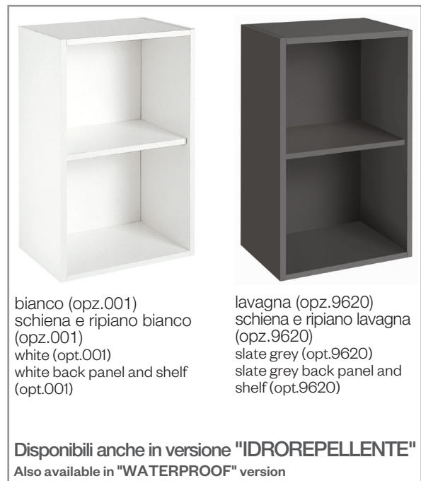
bianco (opz.001) schiena e ripiano bianco (opz.001) white (opt.001) white back panel and shelf (opt.001)