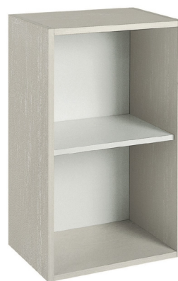
corda decapè (opz.566) schiena e ripiano bianco (opz.001) pickled jute (opt.566) white back panel and shelf (opt.001)