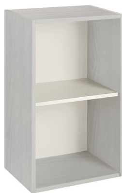
frassino bianco camelia (opz.6055) schiena e ripiano conchiglia (opz.8910) camelia white ash (opt.6055) shell back panel and shelf (opt.8910)