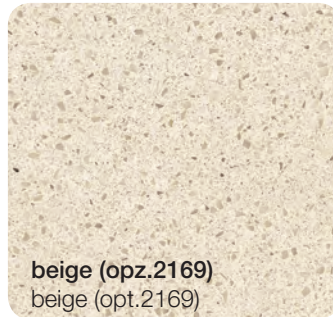
beige (opz.2169) beige (opt.2169)