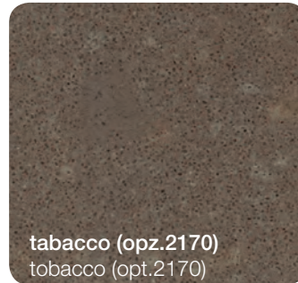
tabacco (opz.2170) tobacco (opt.2170)