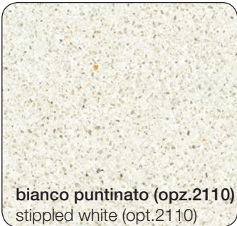
bianco puntinato (opz.2110) stippled white (opt.2110)

CATEGORY "A" GLOSSY COLOURS FOR LAB LUBE WORKTOP