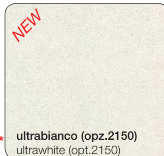
ultrabianco (opz.2150) ultrawhite (opt.2150)