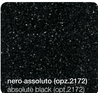
nero assoluto (opz.2172) absolute black (opt.2172)

CATEGORY "B" GLOSSY COLOURS FOR LAB LUBE WORKTOP