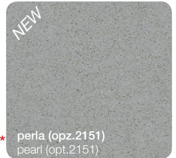
perla (opz.2151) pearl (opt.2151)