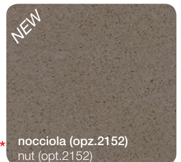
nocciola (opz.2152) nut (opt.2152)

* N.B.: per questi colori sono disponibili le vasche INTEGRA (vedi pag.88) Note: the INTEGRA sinks are available for these colours (see page 88)